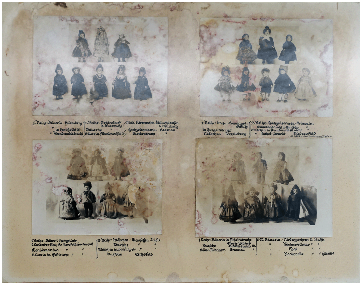
1. Reihe: Bäuerin - Hütenberg 2. Reihe: Pehiesdorf / Mod. Kürzeste, Münchhausen in Hochzeits- b. Marburg d. Marburg " Abendmahlstracht | Bäuerin " Hochzeitsstracht | Rabenau " " | " " | " " | " "