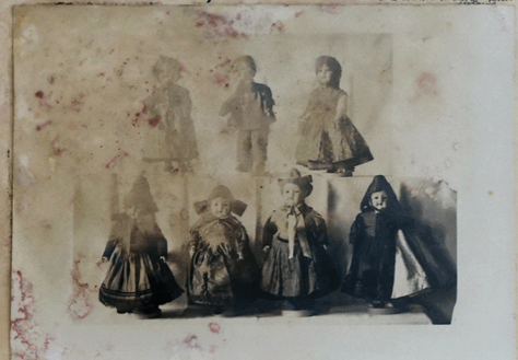
1. Reihe: Bäuerin in Arbeitsstracht 2. Reihe: Bäuerin / Niederwehren b. Rassel Bursche Gerte Waldert Medevollmar " " Bäuer. i. Arbeitsstr. Fraunau " " | " " | " " | " " | " "