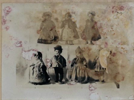
1. Reihe: Bäuer. i. Hochzeitstracht (Landesfesthaus, St. Hirsfeld, Hiedewald) Karlsruhandin " " | 2. Reihe: Mädchen - Kleinfelsen, Rhön Bäuerin in Festtracht " " | " " | " " | " " | " "